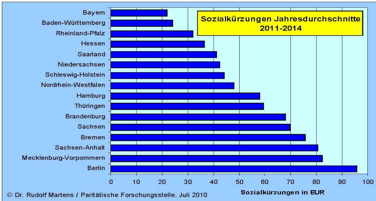
Abbildung 1: Länderdaten der Sozialkürzungen angeordnet nach der jeweiliger Höhe.

jährliche Kürzungen in Euro pro EinwohnerIn